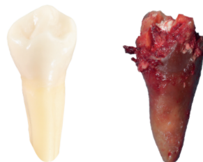
Vergleich eines gesunden Zahnes mit einem wurzelkanalbehandelten Zahn.

Das Problem dabei: Über die vielen kleinen Tubuli und Seitenkanäle wird der abgestorbene Zahn trotz Füllmaterial durch pathogene Bakterien besiedelt, welche das verbleibende organische Gewebe zersetzen und schädliche Stoffwechselprodukte (Toxine) absondern. Trotz entfernter Pulpa steht der Zahn jedoch weiterhin in Verbindung mit dem umliegenden Gewebe, sodass bei jedem Kauvorgang die Bakterien und deren Toxine in das Lymphsystem und die Blutbahn abgegeben werden (fokale Infektion). Der Zahnarzt wird durch sein Instrumentarium niemals in der Lage sein, alle Nebenkanäle des Zahnes abzudichten. Der wurzelkanalbehandelte Zahn stellt somit ein Störfeld für den gesamten Körper dar.